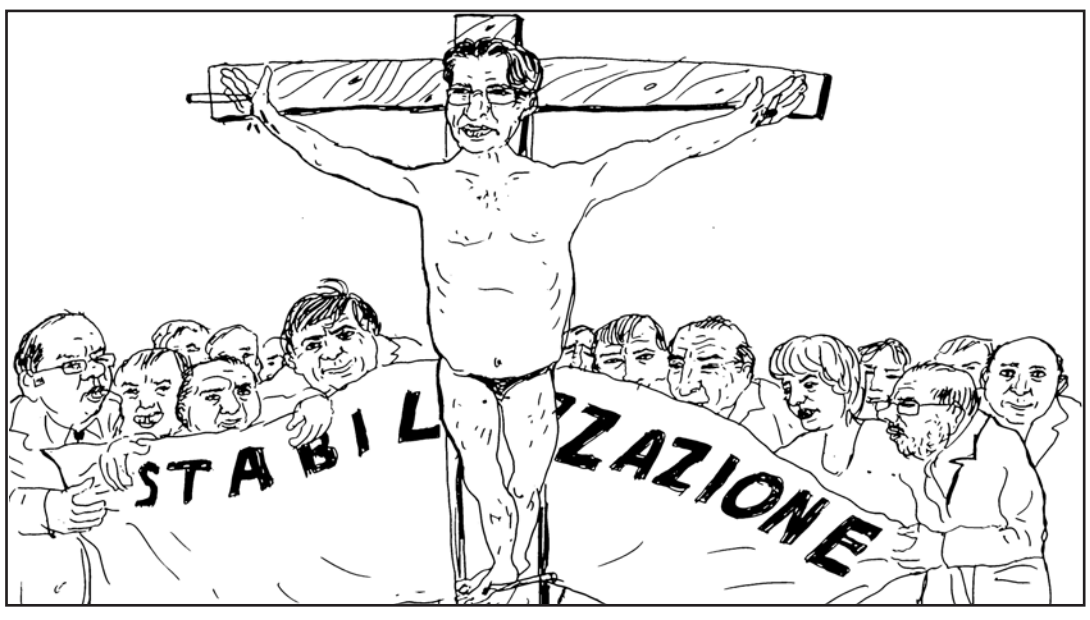
I precari chiedono la stabilizzazione al presidente Crocetta

Deroga alla riforma Fornero, legge dell'Ars entro il 31 dicembre Proroga dei contratti per tre anni, poi il via alla stabilizzazione