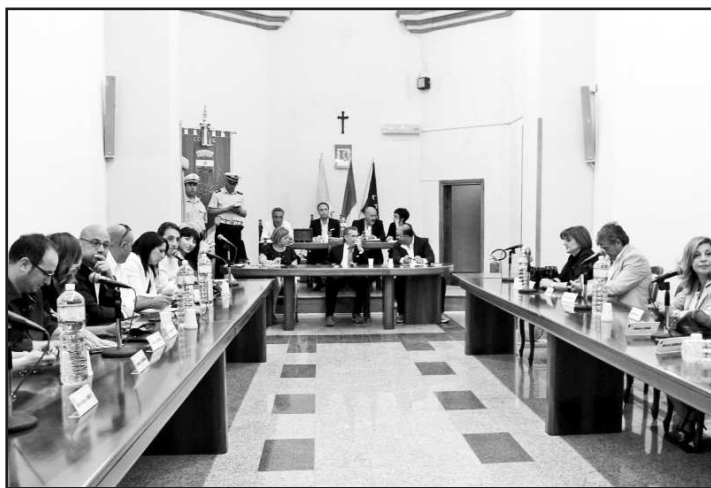
Una seduta del Consiglio comunale

Caracci interroga sul degrado della villa comunale Il primo cittadino: «Pronto restyling complessivo»