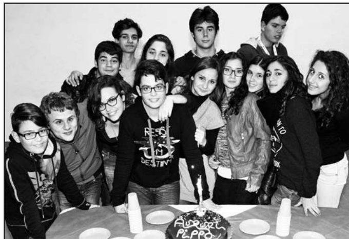
Buon compleanno a Pippo che ha festeggiato 15 anni con una allegra serata tra amici