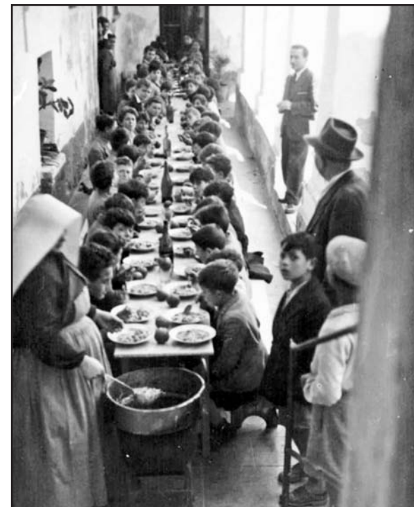
Calatafimi aprile 1949 - Refezione alunni della scuola elementare presso l'Orfanotrofio Blundo