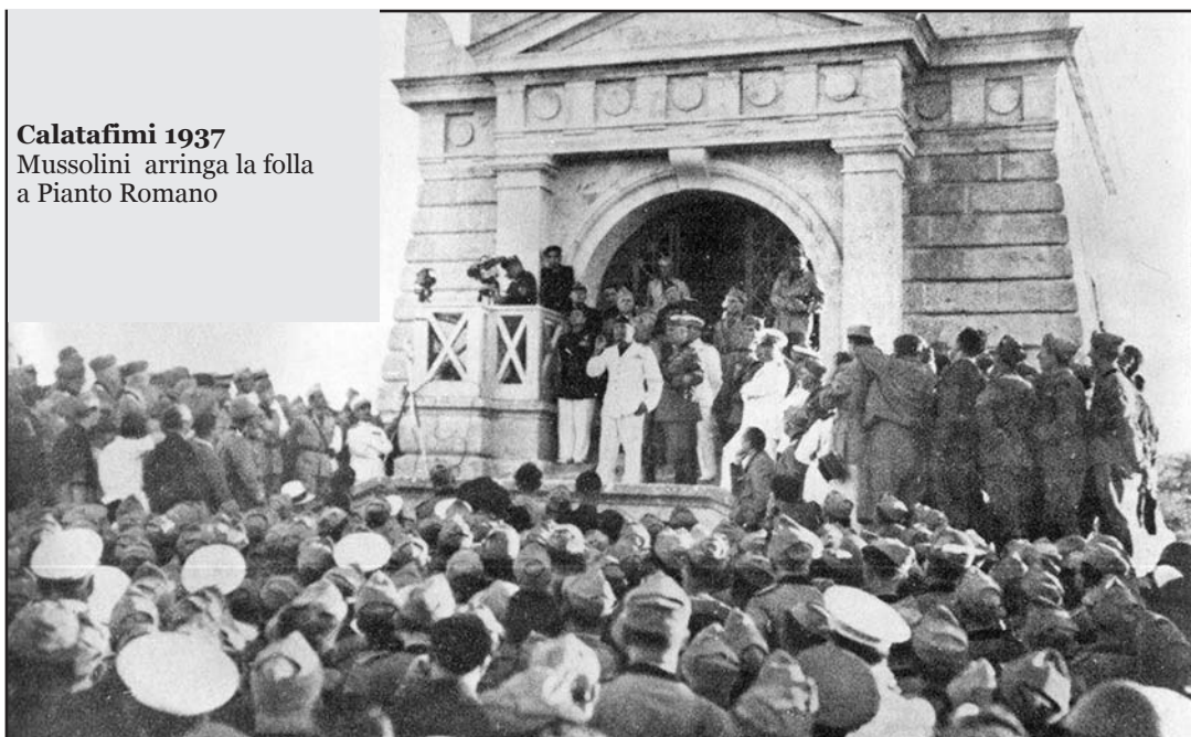
Calatafimi 1937 Mussolini arringa la folla a Pianto Romano