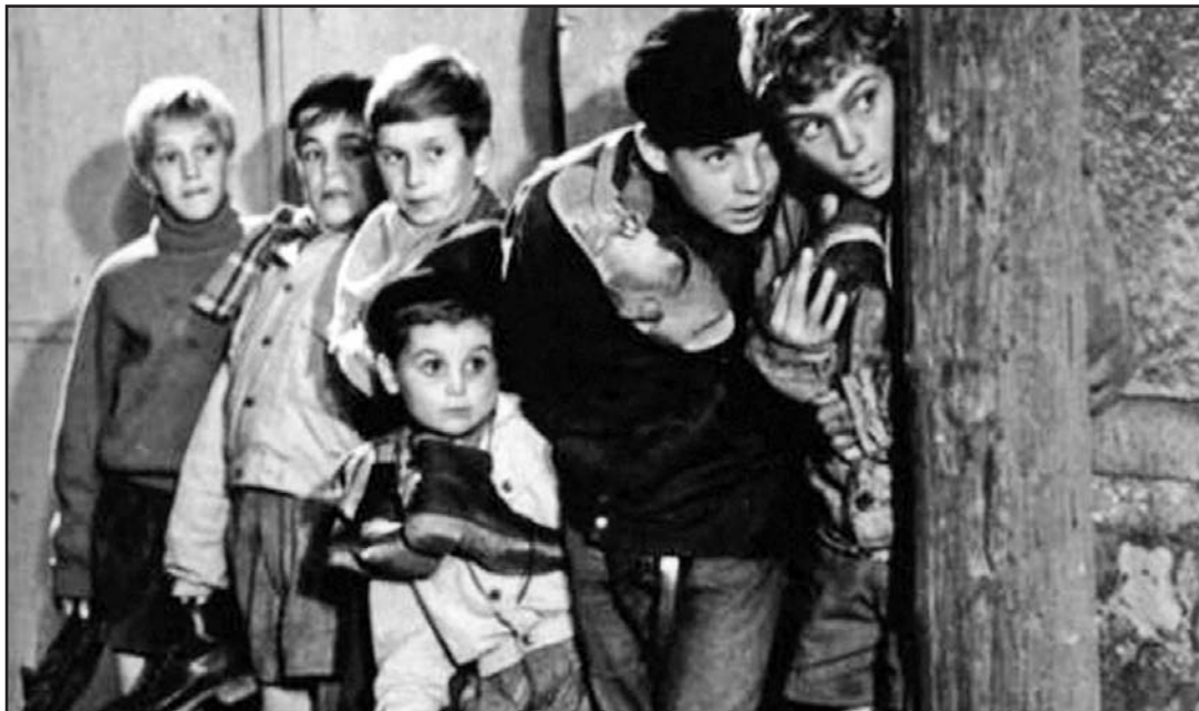
Una scena da «La guerra dei bottoni» (1961) di Yves Robert; a destra Crocifissione di sant'Andrea

Un gioco riconducibile ai riti pagani diffusi nel Nord Europa Un legame con la crocifissione del martire, a Patrasso, nel 60