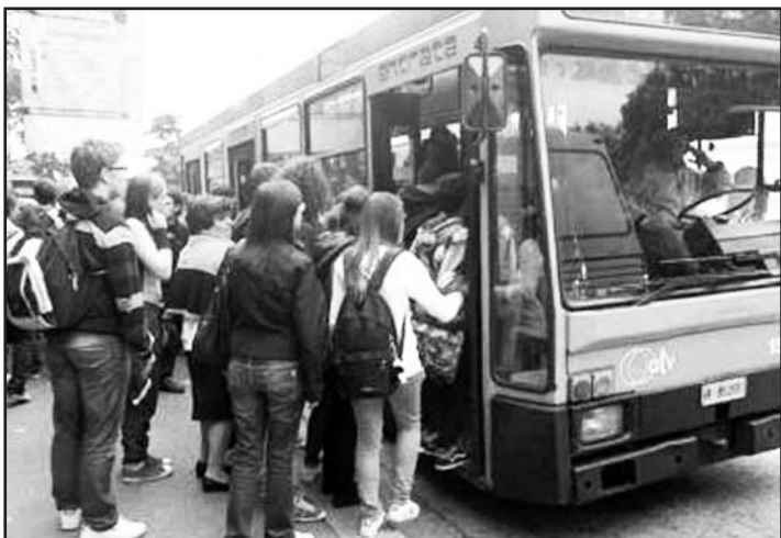
Studenti pendolari; a destra Nicolò Ferrara

Da gennaio l'ente locale coprirà il 70 per cento della spesa per il servizio