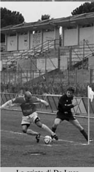
La grinta di De Luca