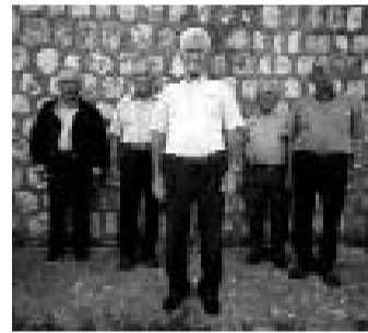
Una foto della mostra