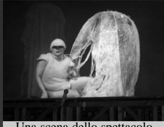
Una scena dello spettacolo

Al Teatro Lelio di Palermo è stato messo in scena lo spettacolo teatrale "La Gabbianella ed il Gatto". I bambini, abituati nell'era in cui prevalgono le immagini televisive, la Play Station e la pubblicità, si sono ritrovati di fronte ad una nuova esperienza scolastica dove il saper ascoltare in silenzio è momento di base. Numerosa ed entusiastica è stata la partecipazione degli alunni del Circolo