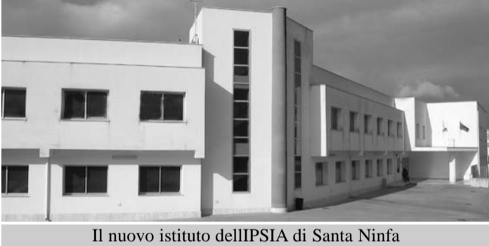
Il nuovo istituto dell'IPISIA di Santa Ninfa

La scuola superiore di Santa Ninfa, sistemata nei nuovi locali costruiti dalla Provincia Regionale di Trapani, in Via Sant'Anna costituisce la concretizzazione di una aspirazione di intere generazioni che si sono formate in locali inadatti, o precari o pericolanti; tante speranze e tanta umiltà nell'attesa e nella fiducia che il Comune e le autorità provinciali mantenessero una promessa che con l'andare del tempo sembrava spesso un sogno o una chimera. Di pari passo con l'aspettativa dell'edificio nuovo è cresciuta la voglia di un polo tecnologico di istruzione secondaria che funziona con attrezzature d'avanguardia e docenti di buon livello. Si aspetta per il prossimo anno scolastico l'apertura del liceo scientifico. Se ne è fatta di strada: dal lontano 1971 in cui partì il primo corso serale per assistenti edili ad oggi. Nel 1968 Santa Ninfa è stata scel-