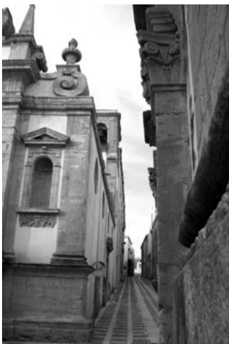
Scorcio di via D'Aguirre

Per prima cosa questo bellissimo centro non è molto ben servito di parcheggi e poiché proprio in centro si trova la sede del Municipio, di tutti gli uffici comunali, di scuole e di Chiese, si può ben comprendere, come sia complicato raggiungere questa destinazione da parte degli impiegati e insegnanti che ogni mattina si devono recare sul posto di lavoro. In secondo luogo la carenza di esercizi commerciali potrebbe essere superata utilizzando la miriade di locali di cui è ricca la via principale, in tal modo, oltretutto, non sarebbe più un'impresa da temerari attraversare la via Amendola dopo una certa ora. Ora, molta gente vorrebbe aprire degli esercizi commerciali, ma anche locali di ristoro, pub o altro, ma tutti lamentano una sorta di ostilità da parte degli uffici competenti a causa di lungaggini burocratiche e soprattutto limitazioni come ad esempio: vincoli a parcheggio e misure standard richieste per determinati esercizi commerciali e tanto altro. C'è una domanda che i cittadini spesso si pongono e cioè: non si potrebbe venire incontro a queste persone di "buona volontà", non tanto dando dei contributi economici per premiare l'iniziativa privata, ma anche operando delle deroghe sulle varie limitazioni di legge? Si pensa che il Comune con