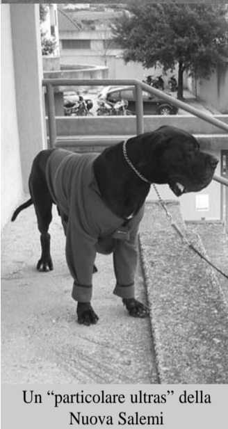
Un "particolare ultras" della Nuova Salemi