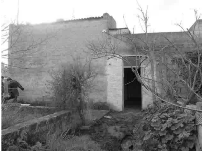
Immobile confiscato alla mafia

Nel mese di Dicembre 2005 è stato assegnato alla Zona Lilibeo, da parte del comune di Mazara del Vallo, un bene confiscato alla Mafia. Si tratta di un immobile circondato da un piccolo appezzamento di terreno sito in C.da Bianca, in direzione Marsala. Già nel 2004 la Zona si era vista assegnato un analogo bene questa volta dal comune di Marsala. Questo è potuto avvenire, grazie a Libera, per effetto della legge 109/96, la quale ha sopperito ad un difetto della normativa sulla confisca già contemplata nella 1.646/82. Praticamente, in precedenza il bene una volta sequestrato e, poi, confiscato (ad es. un fondo agricolo, un immobile urbano ecc...) non veniva acquisito da nessuno. E come si può immaginare, d'altra parte, in Sicilia, un agricoltore che acquisti un bene che sappia essere appartenuto ad un mafioso, verosimilmente conosciuto? In sostanza il bene rimaneva inutilizzato, e improduttivo. Così l'intervento del Legislatore,