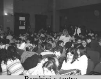
Bambini a teatro