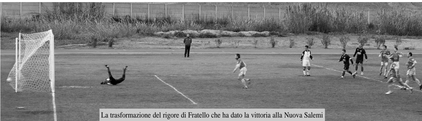
La trasformazione del rigore di Fratello che ha dato la vittoria alla Nuova Salemi